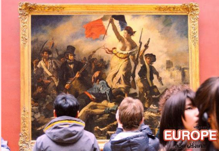
EUROPE สวิต ฝรั่งเศส