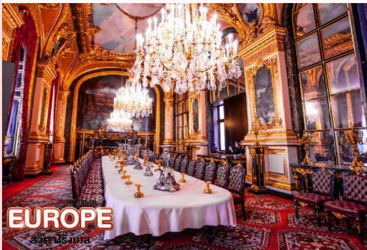
EUROPE สวิต ฝรั่งเศส

และยังมี ห้องชุดของนโปเลียนที่ 3 (Apartments of Napoleon III) ภายในห้องตกแต่งอย่างหรูหรา ชุดเก้าอี้ โซฟา สีเส้นสดใสของผ้ากำมะหยี่สีแดงและสีทอง โคมไฟระย้าขนาดใหญ่ ภาพวาดบนเพดานที่สวยงาม และรูปปั้นประดับตกแต่งอย่างงดงาม