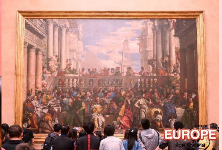
EUROPE สวิต ฝรั่งเศส

และยังมี ห้องชุดของนโปเลียนที่ 3 (Apartments of Napoleon III) ภายในห้องตกแต่งอย่างหรูหรา ชุดเก้าอี้ โซฟา สีเส้นสดใสของผ้ากำมะหยี่สีแดงและสีทอง โคมไฟระย้าขนาดใหญ่ ภาพวาดบนเพดานที่สวยงาม และรูปปั้นประดับตกแต่งอย่างงดงาม