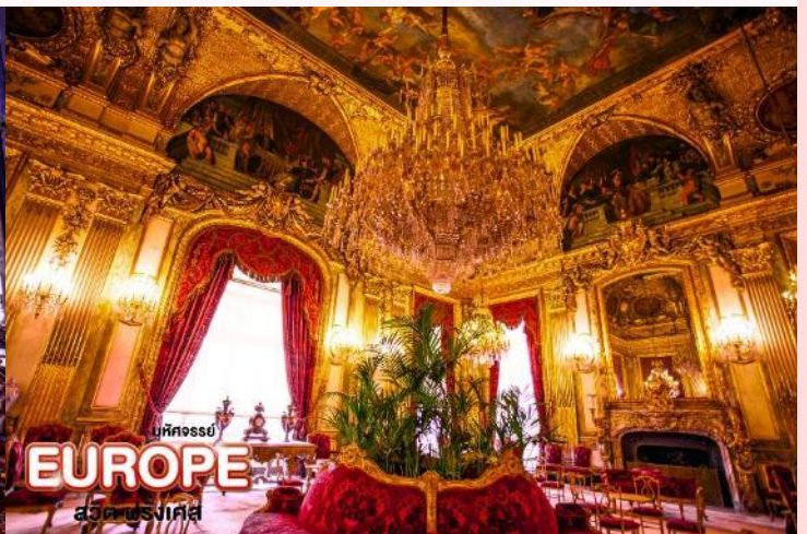
EUROPE สวิต ฝรั่งเศส